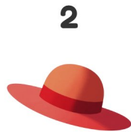
Sombrero de sol