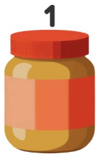
Crema de cacahuete

¡Mira los dibujos y escribe las palabras en inglés!