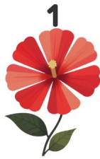
Gloria de la mañana

¡Mira los dibujos y escribe las palabras en inglés!