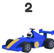
Auto de carreras