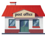
Oficina de correos