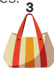
Bolsa de playa