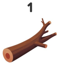
Madera a la deriva

¡Mira los dibujos y escribe las palabras en inglés!