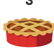
Pay de manzana