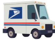
Camión de correos