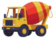
Mezcladora de cemento