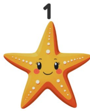
Estrella de mar

¡Mira los dibujos y escribe las palabras en inglés!