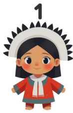
1 Nativo americano

¡Mira los dibujos y escribe las palabras en portugués!