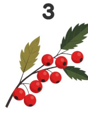
3 Arándano rojo