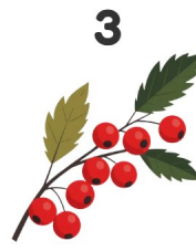
3 Arándano rojo