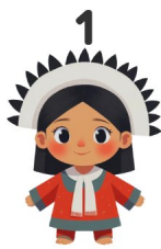
1 Nativo americano

¡Mira los dibujos y escribe las palabras en portugués!