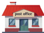
Oficina de correos