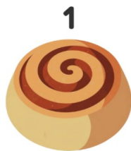
Rollo de canela

¡Mira los dibujos y escribe las palabras en portugués!