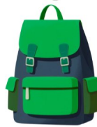
Sac à dos