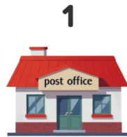
Bureau de poste

Regarde les images et écris les mots en anglais !