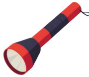
Lampe de poche