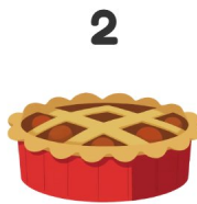
Tarte aux pommes