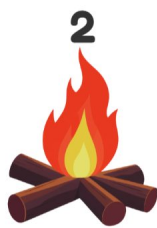
Feu de camp