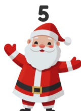
5 Père Noël