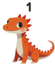
Dragon de Komodo

Regarde les images et écris les mots en anglais !