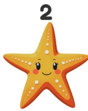
Étoile de mer