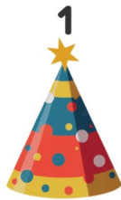
Cappello da festa

Guarda le immagini e scrivi le parole in inglese!