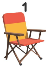
Sedia da campeggio

Guarda le immagini e scrivi le parole in inglese!