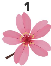
Fiore di ciliegio

Guarda le immagini e scrivi le parole in inglese!