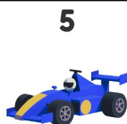
Auto da corsa