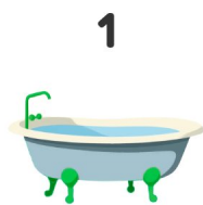
Vasca da bagno

Guarda le immagini e scrivi le parole in inglese!