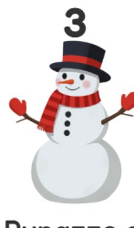
Pupazzo di neve