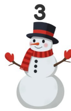
Pupazzo di neve