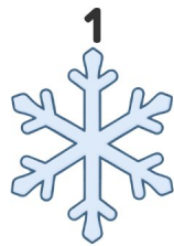
Fiocco di neve

Guarda le immagini e scrivi le parole in inglese!