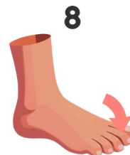
Dito del piede