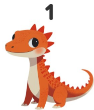
Drago di Komodo

Guarda le immagini e scrivi le parole in inglese!