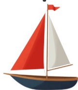
Barca a vela