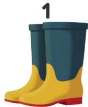
Botas de chuva

Vê as imagens e escreve as palavras em espanhol!