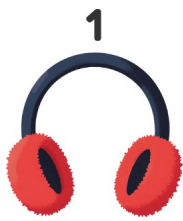
Protetores de ouvido

Vê as imagens e escreve as palavras em espanhol!