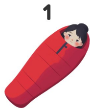
Saco de dormir

Vê as imagens e escreve as palavras em inglês!