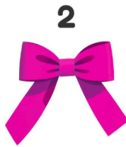
Elástico de cabelo