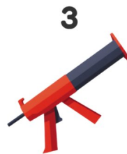
Pistola de calafetagem