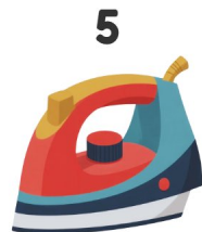
Ferro de passar