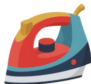
Ferro de passar