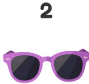
2 Óculos de sol