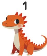
Dragão de Komodo

Vê as imagens e escreve as palavras em inglês!