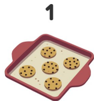
Assadeira de biscoitos

Vê as imagens e escreve as palavras em inglês!