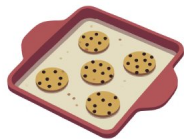
Assadeira de biscoitos